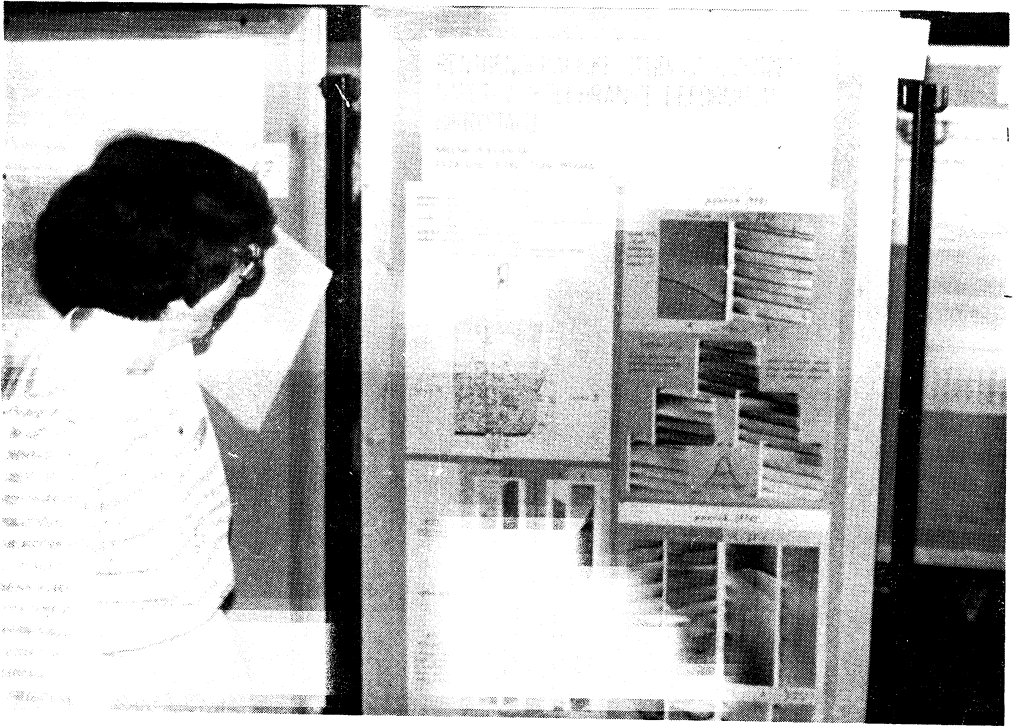
Významnou súčasťou konferencie boli vývesky. Konferencia bola vítanou príležitosťou na diskusie.