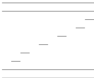
Obrázek 1: Výstup řádků 41–42

Ve skupině comp.text.tex položil Stephen Moye dotaz, jak vysázet první řádek odstavce zarovnaný doleva, další řádky zarovnané na střed a poslední řádek zarovnaný doprava. Paul Vojta [7] v odpovědi definoval následující makro, které toto zarovnání nastaví. 2