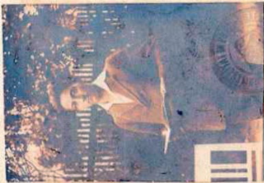
Eigenhändige Unterschrift des Inhabers.