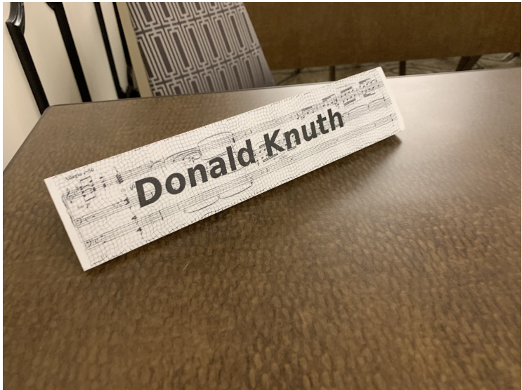
Obrázek 4: Místenka na stole Grand Wizarada na TUG 2019