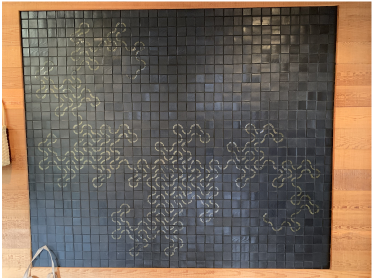
Obrázek 8: Dračí křivka vlastnoručně navržená, vyrobená a vypálená Donem a Jill Knuthovými. Jen chybička se vloudila – najdete ji?