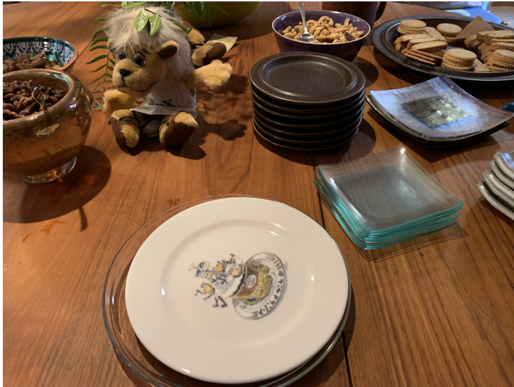
Obrázek 9: T E Xová hostina